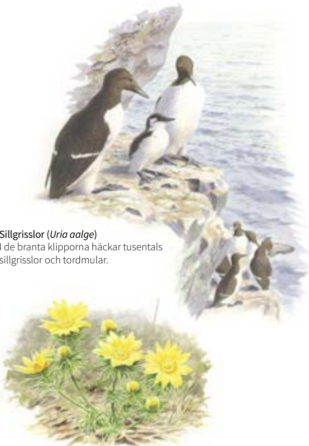
Sillgrisslor ( Uria aalge ) I de branta klipporna häckar tusentals sillgrisslor och tordmular.

Du tar dig till Stora Karlsö med båt från Klintehamn. Till hamnläget kommer du enklast med lokaltrafikens buss 10, som stannar vid Konsum en dryg kilometer från hamnen, eller med bil. Där du tar dig ombord på färjan i Klintehamn är tillgängligheten god. Vid Norderhamn, där färjan lägger till på Stora Karlsö, finns betonglagda stigar som gör att du kan ta dig fram med barnvagn, rullstol eller rullator. Stigarna leder från båten upp till restaurangen och vandrarhemmet. Varför inte ta med fika och njuta av de storslagna klipporna och det rika fågellivet från Norderhamns badplats eller restaurangens uteservering? På vandrarhemmet kan du bo i ett tillgänglighetsanpassat rum med separat utrymme för personlig assistent.