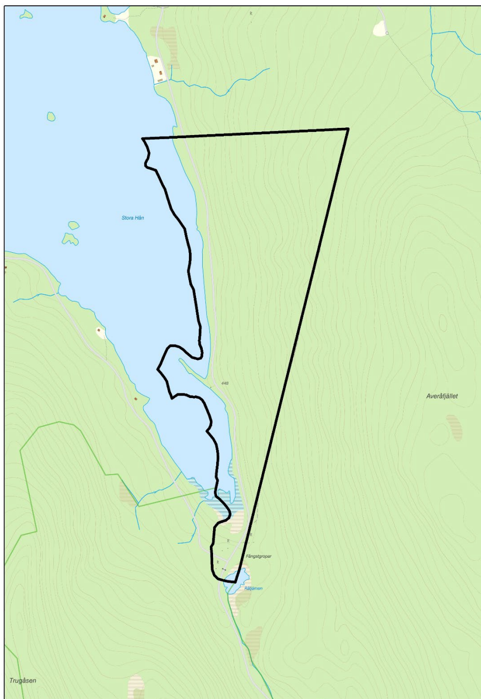
Beslutskarta för Naturreservatet Hån (svart linje).