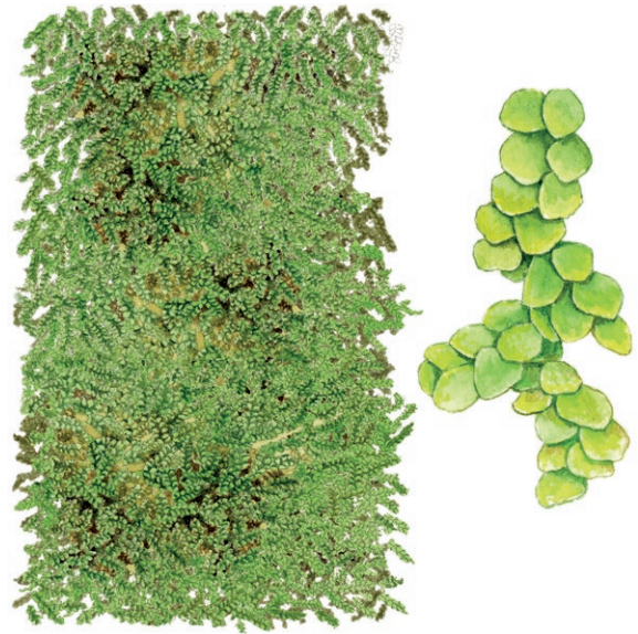
Vedsäckmossa förekommer på grov murken ved i gamla urskogsartade granskogar. Den växer främst på granved. Längst till höger ses en förstoring av mossan.