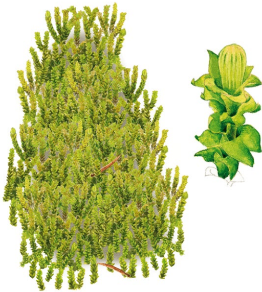
Skogstrappmossa växer vanligen på murkna, grova, liggande döda granar i barrskog. Den kan också hittas på skuggiga och fuktiga klippor. Uppe till höger ses en förstoring av mossan.