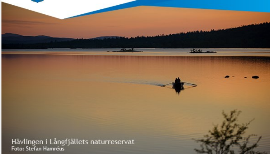
Hävlingen i Långfjällets naturreservat