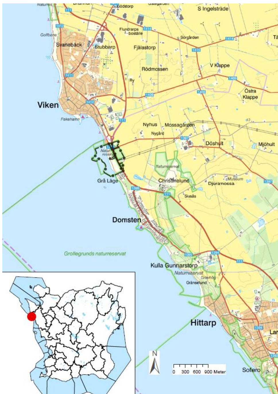
Figur 1. Naturreservatet Domsten-Viken i Helsingborgs stad. Punktstreckad svart linje anger naturreservatets gräns. Den röda cirkeln anger ungefärligt läge.