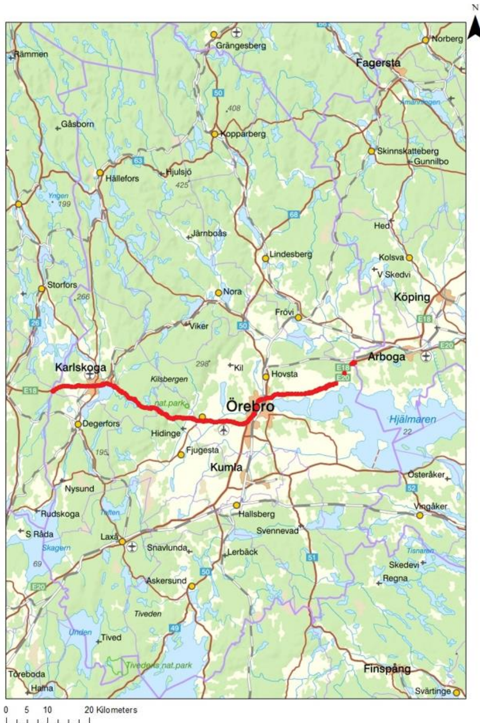
Figur 3: Kartbild över Örebro län. Länet delas upp i två jaktområden: Norra länsdelen och Södra länsdelen. Gränsen mellan jaktområdena visas med en tjock röd linje. Licensjakt får ske den 1 mars – 31 mars 2022, eller till den tidigare tidpunkt då Länsstyrelsen avlyser jakten.