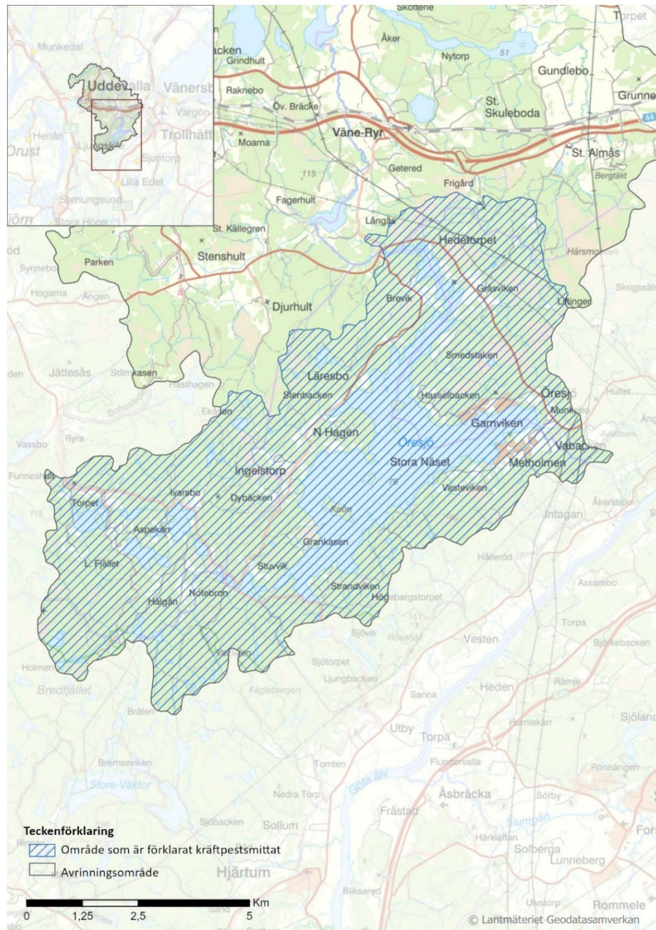
Karta 1. Öresjö och dess avrinningsområde.