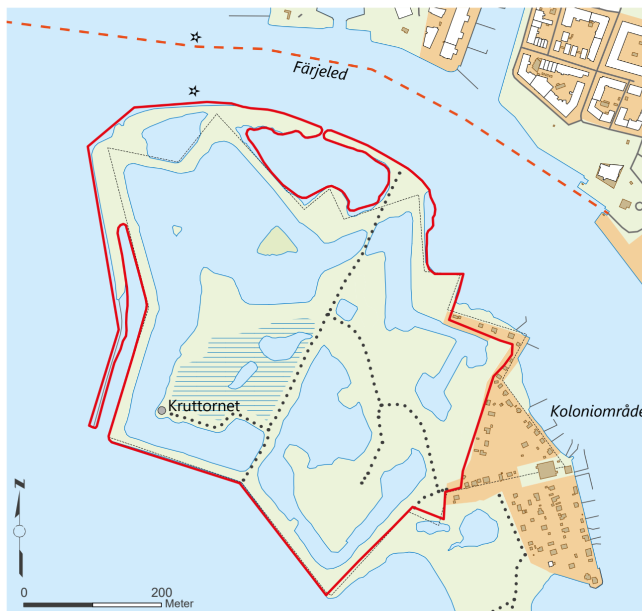
Länstyrelsen Skåne