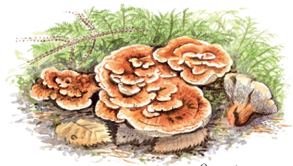
Orange taggsvamp Illustratör: Jonas Lundin

Strax norr om Saxeknut ligger naturreservatet Knuthöjdsmossen och i öster naturreservatet Hammarmossen.