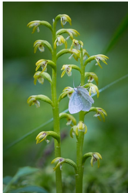
Dagfjärilsmätar på korallrot.

Reservatet angränsar i norr ett gammalt torpställe i Rombohöjdens by med anor från den finska invandringen på 1600-talet. Större delar av skogsmarken har sannolikt använts som skogsbete, delar har varit slåtteräng. Stenmurar och spår av gamla körvägar finns på några ställen, likaså spår av kolbottnar.