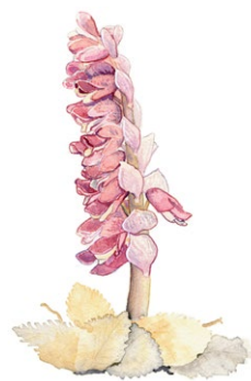
Vätteros.