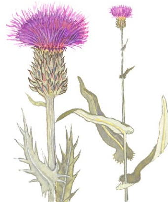
Brudborste. Ill: Michael Holmberg

Växtligheten är som rikast i nedre delen av sluttningen, tack vare kalkrikt vatten som rinner fram ytligt i marken. Här är skogen rik på lövträd och på marken växer örter som blåsippan, gullviva, stinksyska och brudborste. Kanske lägger du märke till den säregna vätterosen - en växt utan det gröna färgämnet klorofyll - som lever som parasit på lövträd, framför allt hassel.