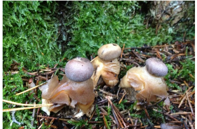
Fyrflikig jordstjärna.

Mårdshyttan och Fanthyttan ligger i ett område med urkalksten. Att marken är kalkpåverkad märks inte minst på växtligheten. Här finns många arter som är specialanpassade till just kalk. Ett exempel är den sällsynta kalkbräken som växer rikligt här. Sårläka, skogsknipp-rot och loppstarr är andra kalkgynnade växter. Även bland svamparna hittar vi många spännande arter, flera som bara går att hitta i gamla kalkbarrskogar som här, som den lila violgubben och den flattoppade klubb-svampen. Eller vad sägs om den sällsynta fyrflikiga jordstjärnan. Den fuktiga och kalkrika miljön uppskattas även av mossorna, med arter som kalkkammosa, kalkkällmossa och kamtuffmossa.