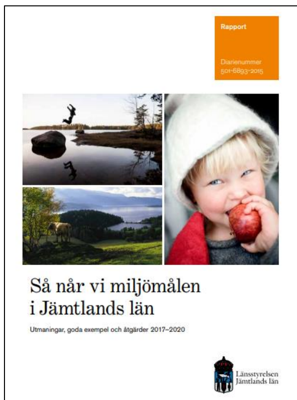
Miljömålsprogrammet "Så når vi miljömålen i Jämtlands län"

Utvärderingen är genomförd och rapporten är skriven av Länsstyrelsens miljömålssamordnare.