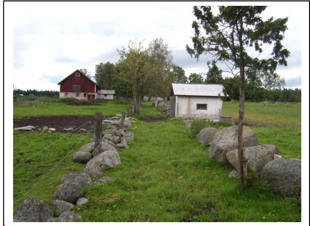
På gård i Viby socken letar sig enskilda stenmurar och fågator sig ut i den väster ut belägna skogen.