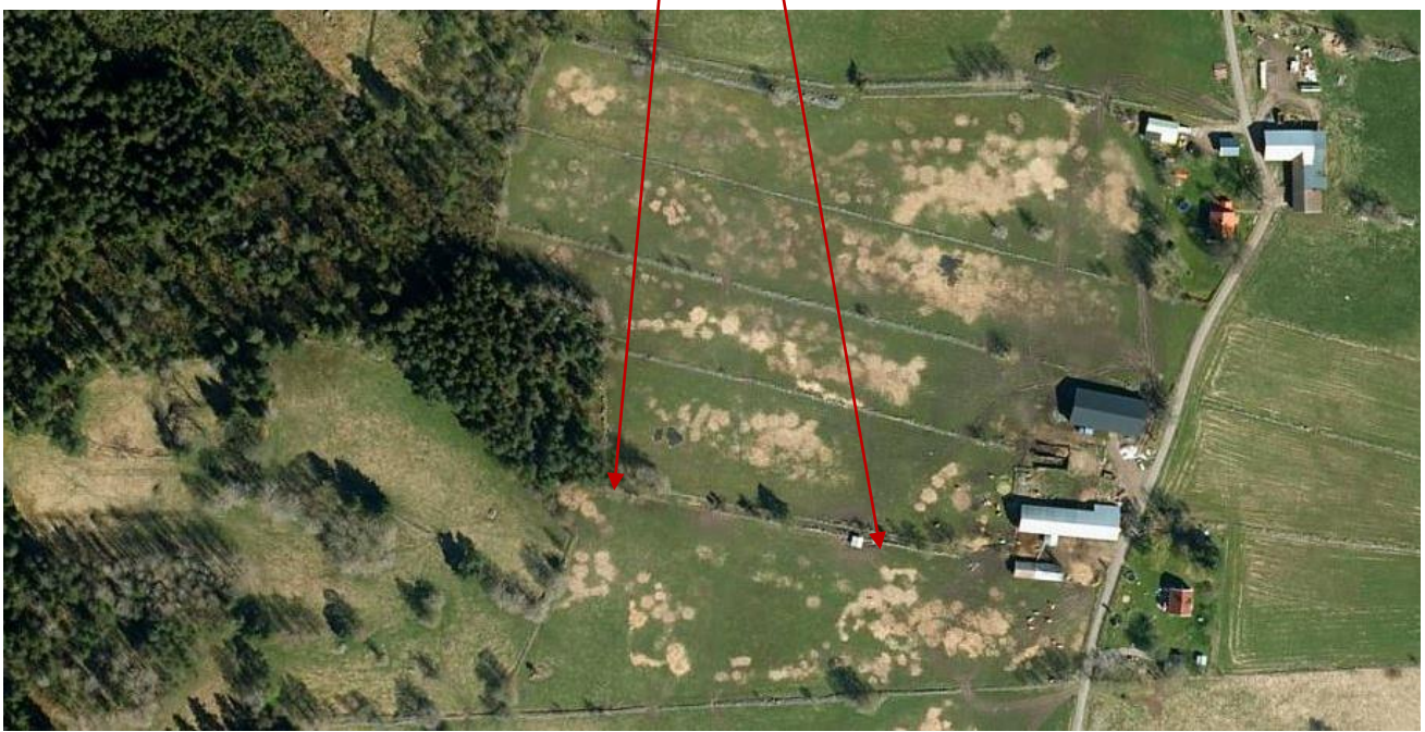
Flygfoto-bilden visar flera stenmurar och ett par fågator

Fågatan kom alltmer att spela ut sin roll. Anläggandet av insådda vallar för bete blev vanligare. Ju närmare gården desto bättre då tillsyn och mjölkhanteringen underlättades. Vallarna gödslades med stall- eller handelsgödsel. Gödslade vallar ersatte ett extensivt skogsbete. Produktionshöjande insatser för att föda en alltmer växande befolkning.