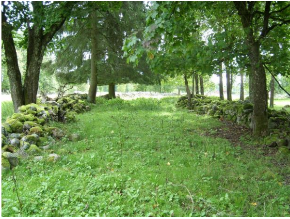
I den trädbevuxna hagmarker breddar sig fågatan.