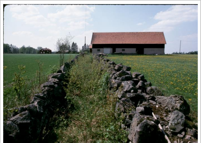
Fågata vars högra sida utgörs av en skalmur och den vänstra en enkelmur. Småländsk landsbygd.

Konstruktioner av trä (hankärdsgård) som inte underhållits genom åren, har försvunnit. Där kan man möjligen skönja vägen med hjälp av äldre kartmaterial. I vissa fall har den tidigare fågatan breddats och fungerar i dag för tyngre transporter inom gården eller byn. Men det började som ett fädrev!