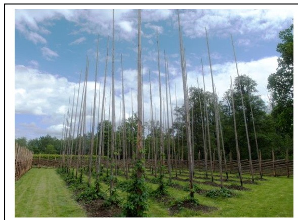
Humlestänger i visningsträdgården på Karlslunds herrgård**, 2019.

att hädanefter importera råvaran. En parallellutveckling till humlen. Svensk humle kunde inte konkurrera med all importerad och det var billigare att köpa utifrån. Men så har situationen ändrats till den närodlade humlens fördel, åtminstone i den lilla skalan.