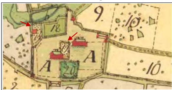
"2 de Små humlegårdar vid gården". Småprickade ytor. Geometrisk avmätning 1741. Tvnninge i Kumla socken.

Detta gällde inte bara humle utan även hampa och lin. Den senare odlades förvisso i Stora Mellösa och i länets skogsbygder under 1800-talet, men för att tillgodose behovet, köptes lin in från Västergötland, men även mer långväga leveranser inkom. Humle, lin och hampa odlades förvisso till husbehov men några större handelsvaror blev de aldrig.