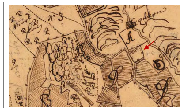
Humlegården ligger söder om och i anslutning till byplatsen, A. Geometrisk karta 1663, Nyhyttan söder om Åmmelången, Hammars socken. I beskrivning noteras 300 stänger.

I kartmaterialet skimtar humlegårdar förbi, oftast som små avgränsade täppor med prickmarkeringar, som humlestörrar sedda från ovan. I kartbeskrivningar noteras antalet stänger. Humlegårdarna är belägna nära vad man idag kallar brukningscentrum. I det äldre kartmaterialet, fram till enskiftet, eller 1800-talets början, visas humlegården mer som en den vore en byangelägenhet.