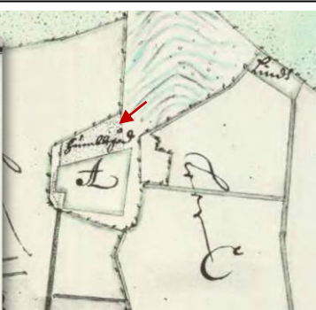
Humlegården om 600 stänger, norr om och i anslutning till byplatsen, A. Geometrisk karta 1688, Gillberga i Sköllersta socken.