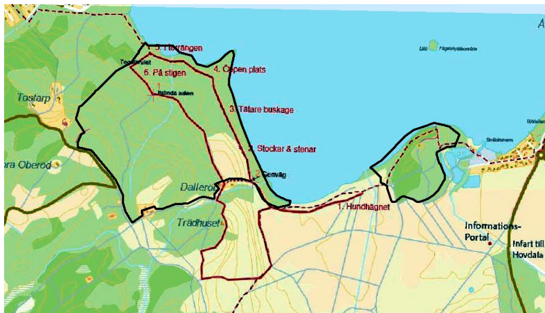
Hundslingan markerad med röd linje.