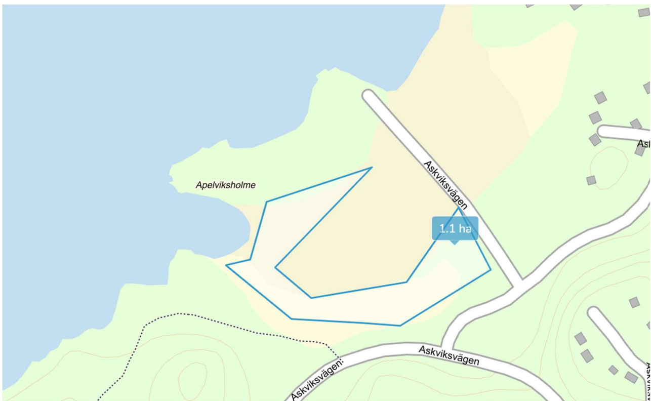
Karta 1. Karta över betad strandäng vid Apelviksudd på Gålö, området visar aluppslag.