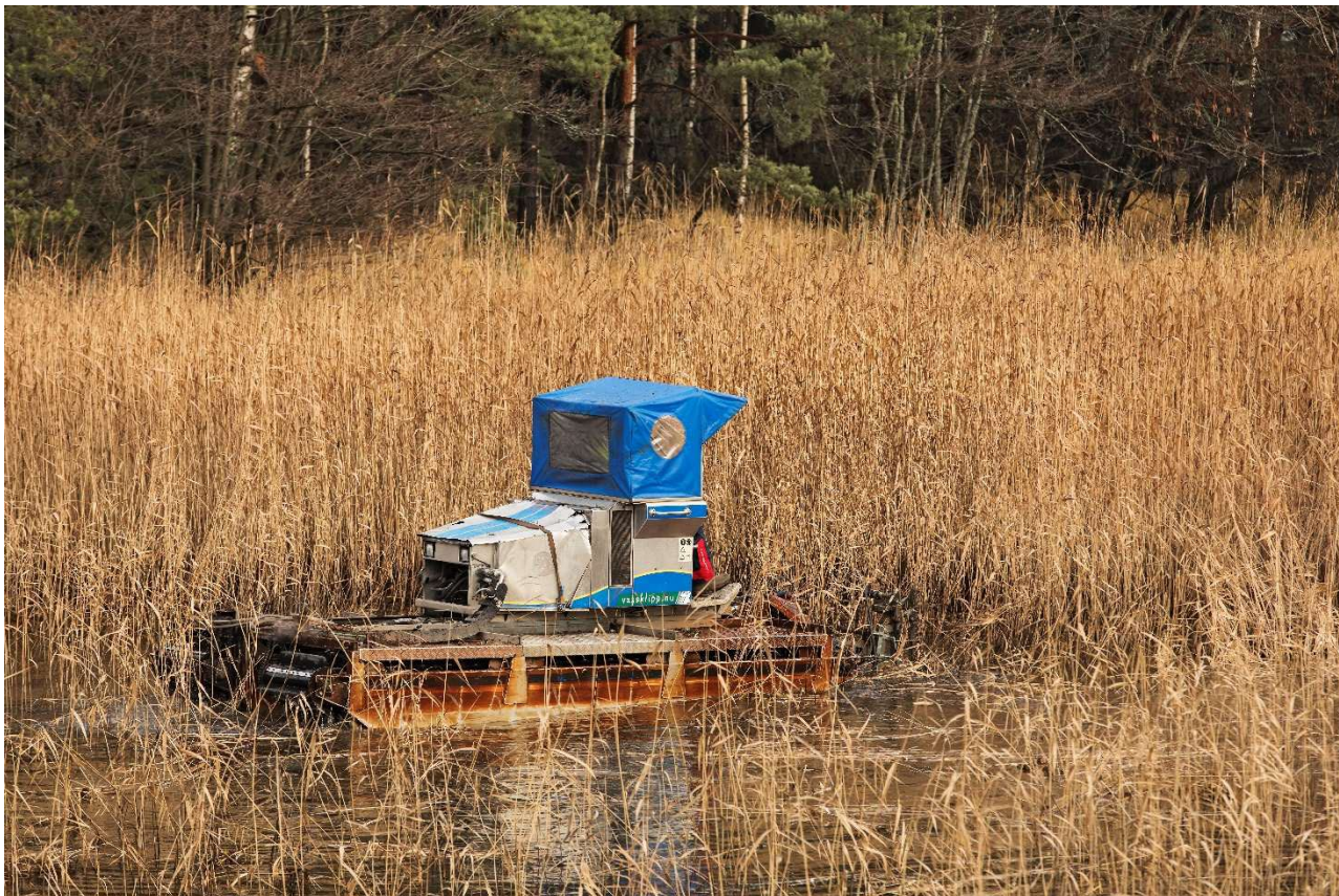
Bild: Vassklippning med amfibiegående maskin.

Apelviksudd vid Gålö | Haninge | 590635-182120