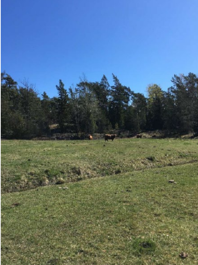
Bild: Strandängar på Björnö med betande kor.