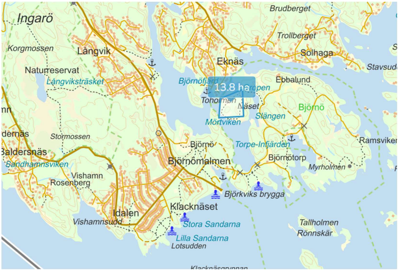
Karta 2: Karta över hela Björnö.