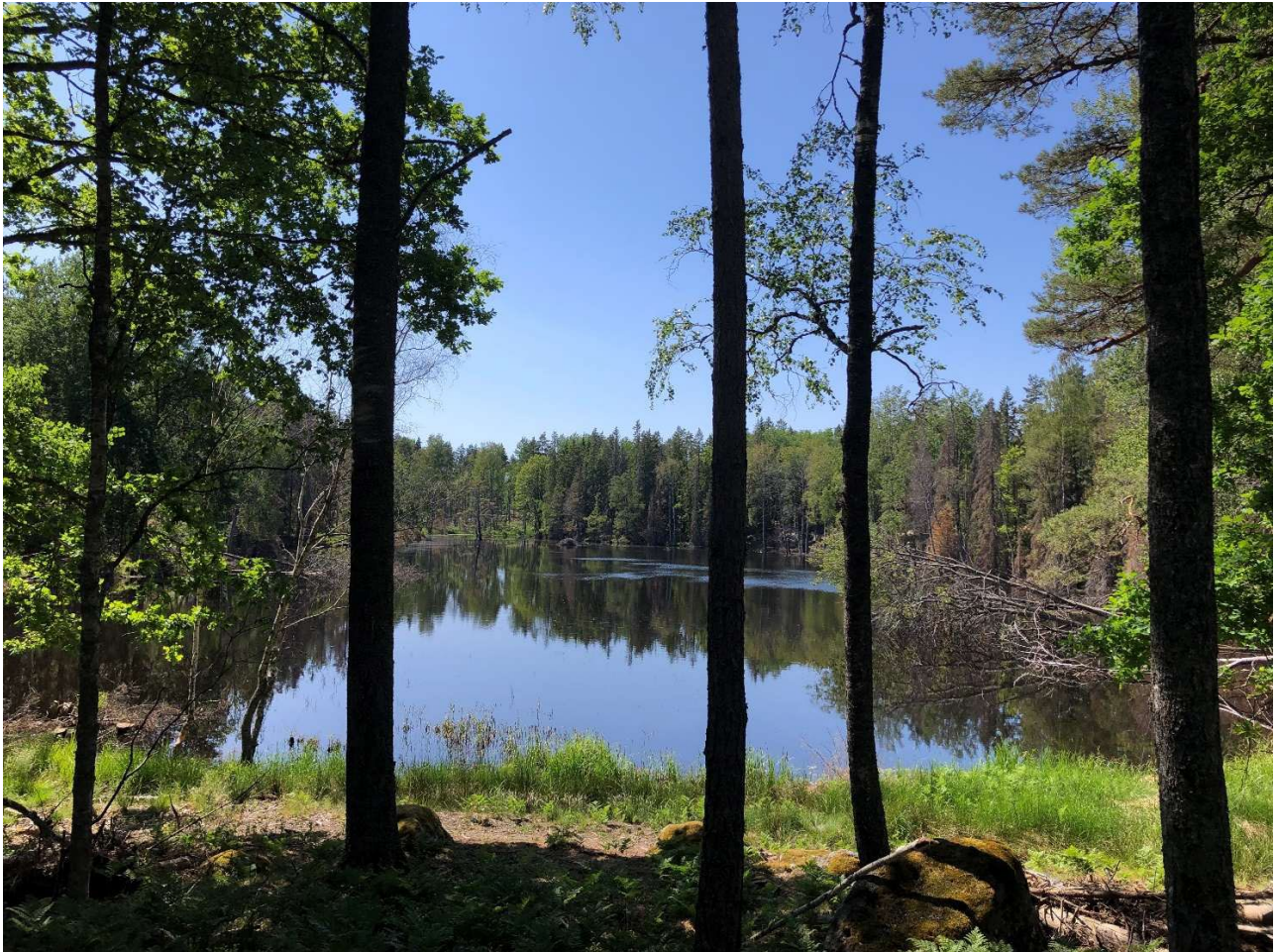
Bild: Våtmark på 5 ha i norra Kärringoda.

Våtmark i norra Kärringoda | Nynäshamn | 584960-175280