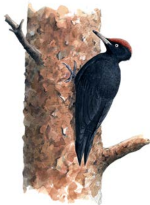
Spillkråka på tallstam. Illustration: Niklas Johansson