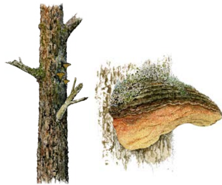
Tallticka, förstoring till höger. Illustration: Lennart Molin

Frodiga lundväxter som vårärt och trolldruva är sällsynta i barrskog. Att de växer i Nygårdsvulkanens skogar beror på den kalkrika berggrunden som bildades under en turbulent tid i jordens historia, då det fanns aktiva vulkaner i trakten.