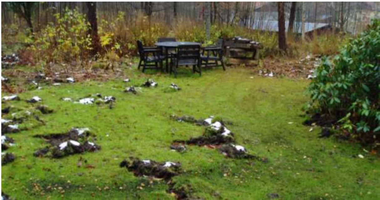
Trädgård som har haft besök av vildsvin.

Vid uppkomna problem med vildsvin i detaljplanerat område kontaktas kommunen. I övriga fall kontaktas jakträttshavare och/eller markägare. Detsamma gäller vid skador i trädgårdar på landsbygden, där jakt och stängsling kan vara de bästa lösningarna för att hålla vildsvinen utanför.