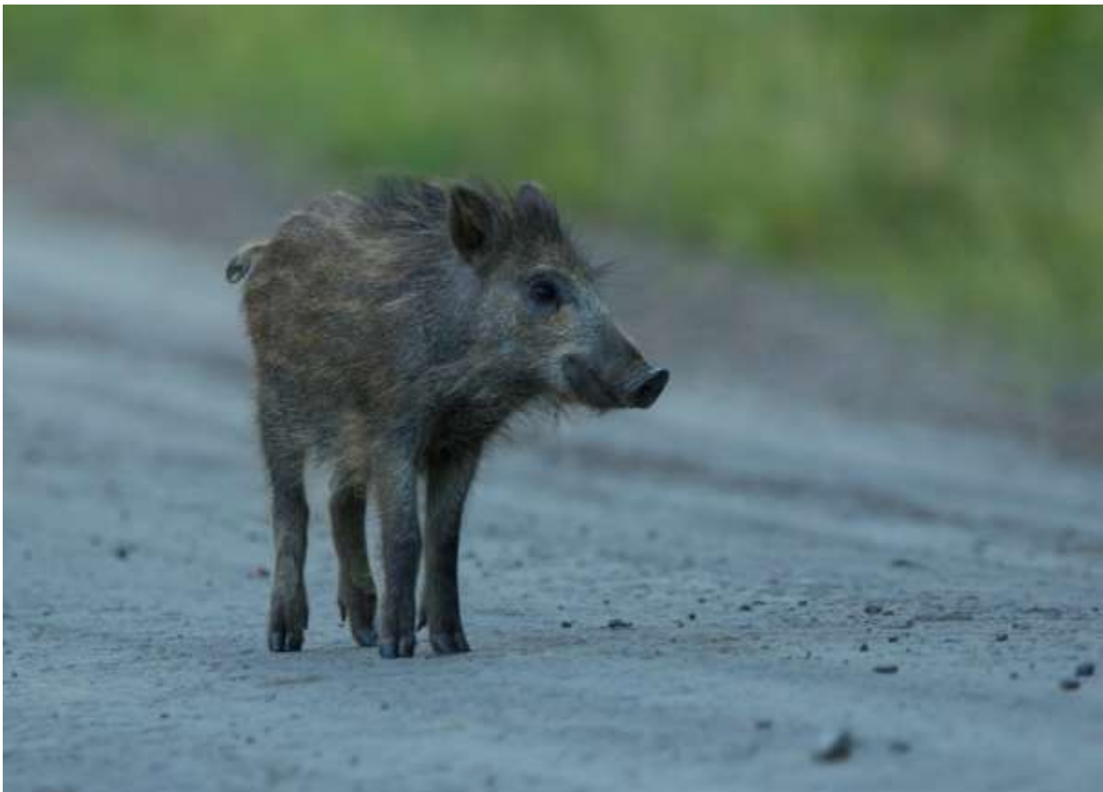
Vildsvinskulting på grusväg.

Det finns ett flertal jaktmetoder för vildsvin, och vad som är mest lämpligt styrs av de lokala förutsättningarna. Vid användning av fällor får endast godkända sådana användas. Trots att en hög avskjutning krävs får avkall aldrig göras på etik eller säkerhet. Utbildade eftersöksexperten ska finnas tillgängliga vid varje jaktsituation.