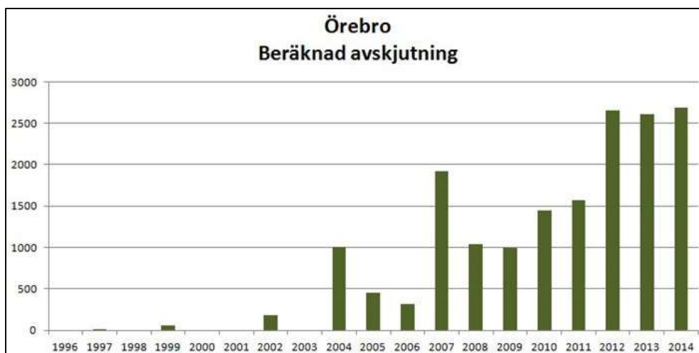
Figur 1. Beräknad avskjutning i Örebro län. Svenska Jägareförbundet.

Under perioden 1 juli 2014 – 30 juni 2015 fälldes ca 2 600 vildsvin i Örebro län enligt Jägareförbundets avskjutningsstatistik (jmf 1 400 under 1 juli 2010 – 30 juni 2011, figur 1).