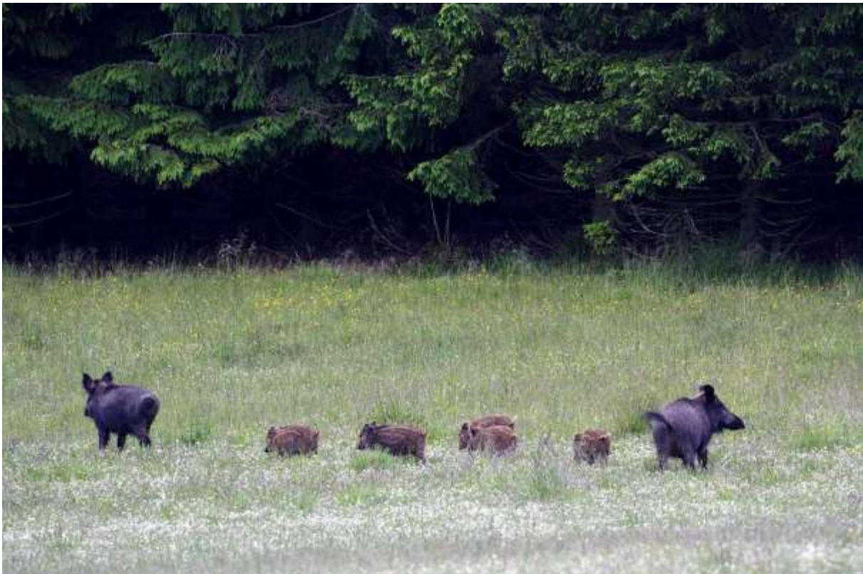
Vildsvin på fält invid skogsmark.

Vid åtling av vildsvin är det tillåtet att sätta upp fast belysning för att underlätta jakten. Jakt efter vildsvin får även ske vid belysning som satts upp vid väg eller byggnad i annat syfte än jakt. Därutöver kan länsstyrelsen lämna personliga tillstånd till användning av rörlig belysning eller elektronisk bildförstärkare, t.ex. då man befärdar allvarliga skador i grödor eller i trafiken. Länsstyrelsen har även möjlighet att lämna tillstånd till jakt från motorfordon. Sådant tillstånd bör endast lämnas vid påtagliga risker för allvarliga skador, t.ex. i samband med skydds jakt på myndighets initiativ.