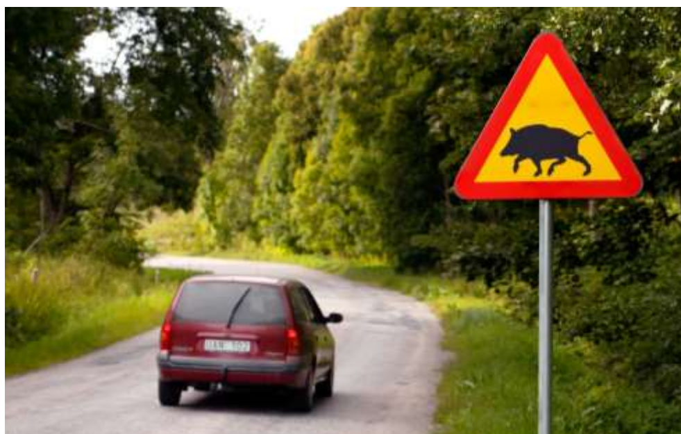
Varning för vildsvin utmed landsväg.

Det regionala viltolycksrådet identifierar regelbundet speciellt olycksdrabbade vägvagnsnitt, och tar initiativ till åtgärder för att minimera olycksrisken genom t.ex. siktröjning och uppsättning av varningsskyltar. Rådet är sammansatt av representanter från Polismyndigheten, Trafikverket, eftersöksjägarna, och Länsstyrelsen. Mer information och kontaktuppgifter finns på www.viltolycka.se