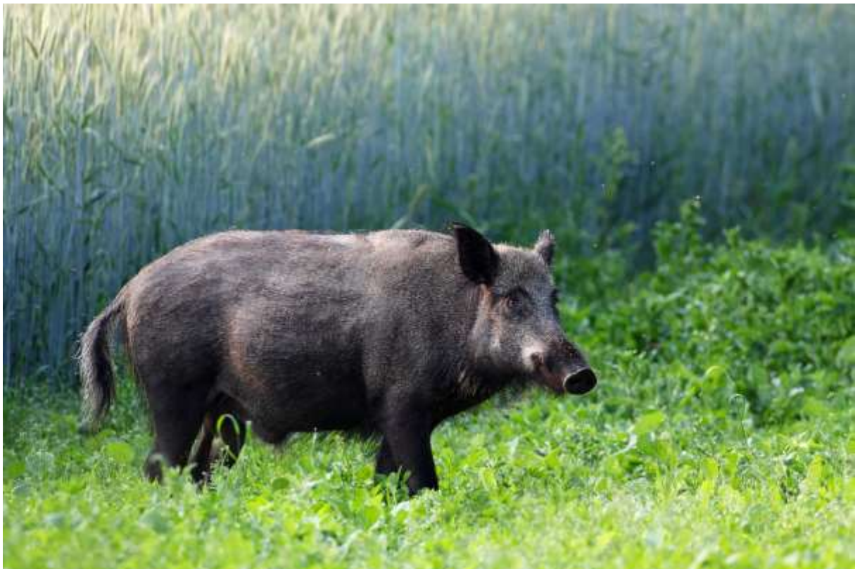
Vildsvin på åkermark.

I den förvaltningsplan som fanns för år 2012–2015 fanns målet att snarast reducera populationen av vildsvin för att kraftigt minska skadeverkningarna i lantbruk, naturområden och i trafiken. På vissa håll kan detta mål ha uppnåtts. Där man har haft vildsvin under en period har jägare och markägare på många håll hittat metoder att hantera skadesituationen. I områden dit vildsvinen precis anlant kan skadesituationen dock vara besvärande.