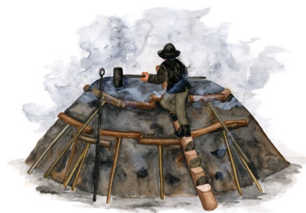
Kolmila. Illustration: Margareta Hildebrandt

Inte långt härifrån ligger den gamla hyttan i Bocksboda. Järnframställningen krävde stora mängder träkol. Traktens skogar var troligen hårt utnyttjade för kolvedhuggning. I reservatet finns flera rester av kolmilor, så kallade kolbottnar.