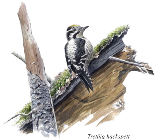
Tretåig hackspett Illustration: Niklas Johansson