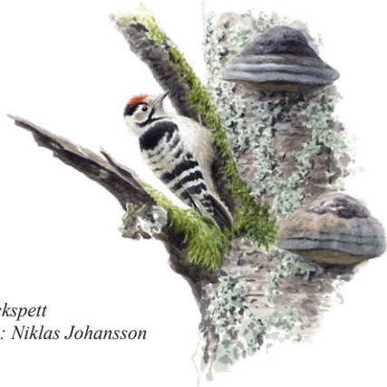
Mindre hackspett Illustration: Niklas Johansson

Naturreseptat Baggetorp består av två skogsområden där den artrika gammelskogen bevaras för framtiden. Delar av skogen i området är över 100 år gammal. Här trivs såväl hackspettar som ugglor av olika slag. En markerad stig tar dig runt i det större området i norr.