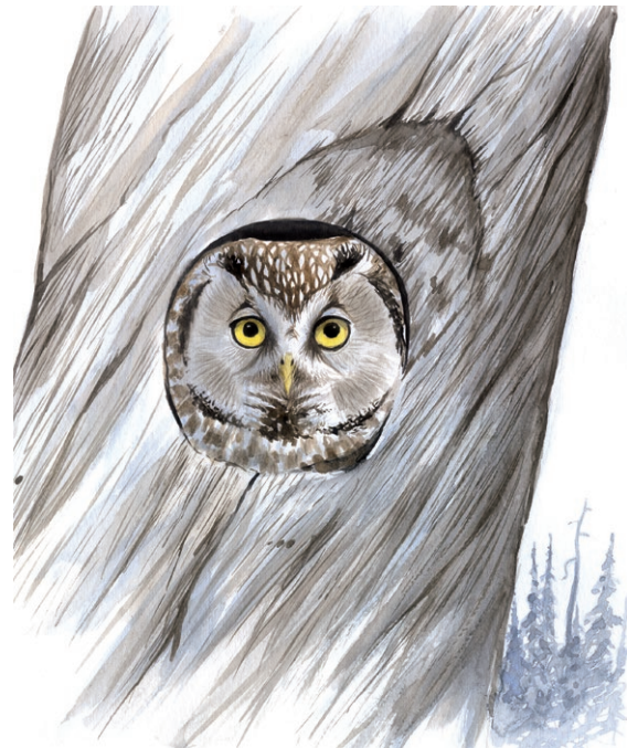
Pärluggla Illustration: Jonas Lundin

Reservatet bildades 1996 efter initiativ från två lokala föreningar, Dormens hembygdsförening och Väster närkes naturskyddsförening. I anslutning till reservatet ligger Baggetorps hembygdsgård. Boningshuset är en typisk så kallad Närkestuga i två våningar. Till gården hör också en smedja, stall och timrad ekonomilänga. Gården hade andelar i Mullhyttans hytta som tillverkade järn. Runt gården finns åkrar och hagmarker, stigar och gamla körvägar. Här finns också ett över trehundra år gammalt äppelträd.