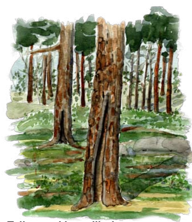
Tallar med brandljud

Fram till 1645 gränsade Jämtgaveln mot Norge. Pilgrimer som vandrade från kusten till Nidaros (Trondheim) passerade genom området under medeltiden. Det berättas att de kunde övernatta i ett så kallat segelsehus på Bastunäset vid sjön Torringen. I reservatet finns många synliga fornlämningar. Vid Raskbodarna och Nybyggevallen finns rester efter fäbodrar. På Bastunäset finns lämningar efter ett nybygge som var bebott 1866-1900. Kring fäbodrar och nybyggen är markerna mer öppna och bevuxna med örter och gräs. I området kan du också hitta spår efter 13 skogsarbetarkojor, en spardamm som använts vid flötning och en fångstgrop.