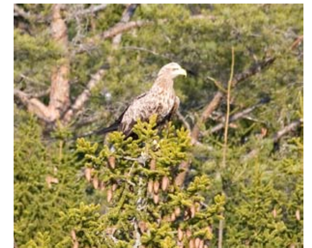
Havsörn ( Haliaeetus albicilla ) kan ibland ses inom området.