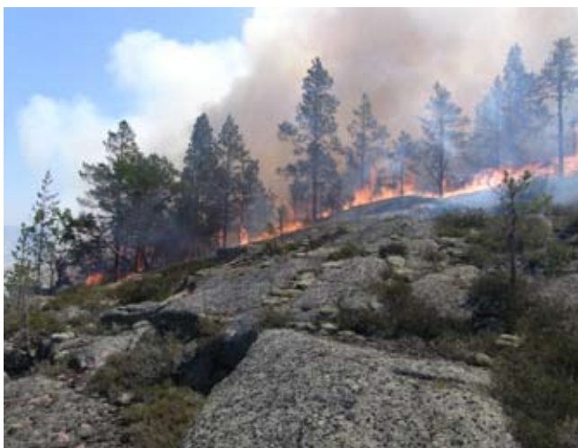
Branden på Balesudden i juni 2008.

Tänk på att träd som dödat i branden kan utgöra en fara när de ramlar omkull!