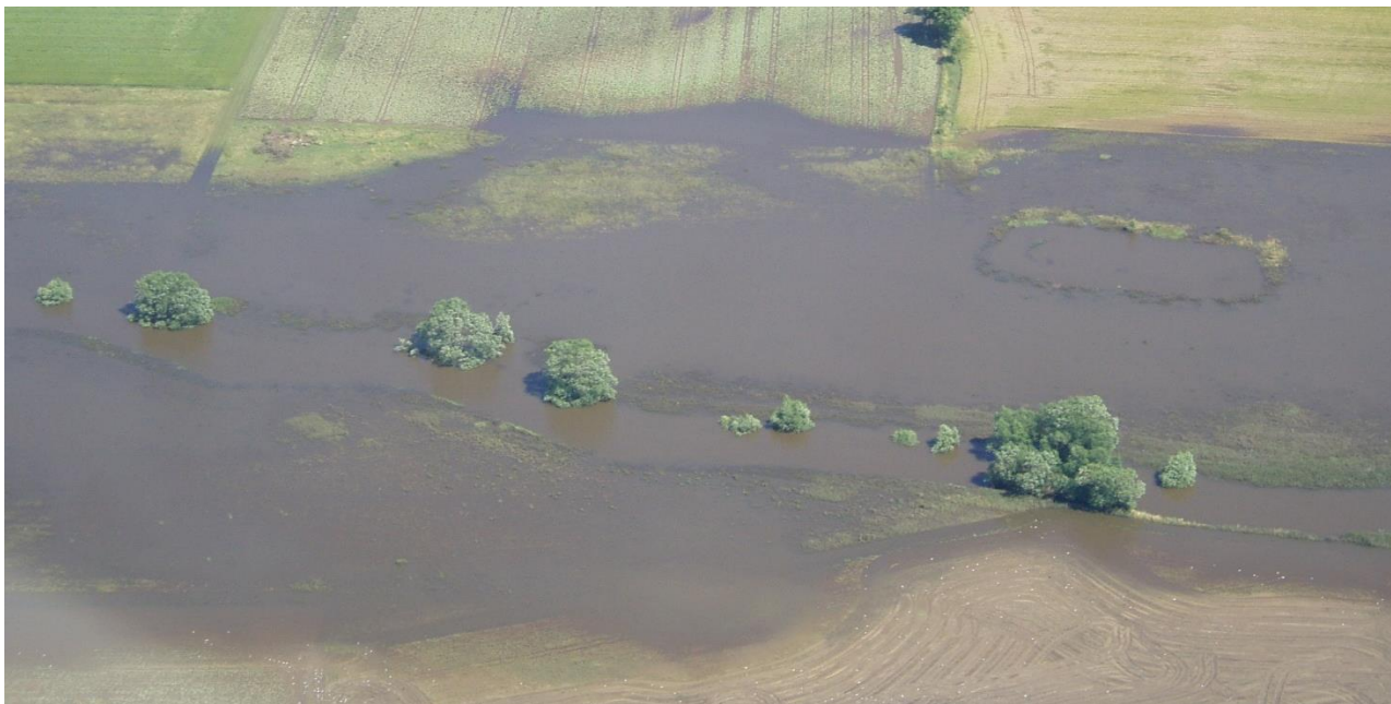
Bild: Exempel på översvämmad jordbruksmark i den nedre delen av Vege å där huvudfåran rätats och rensats och där det finns åtgärdspotential.

Vege å | Svalövs, Bjuvs, Helsingborgs, Ängelholms, Åstorps och Klippans kommun | HARO 95