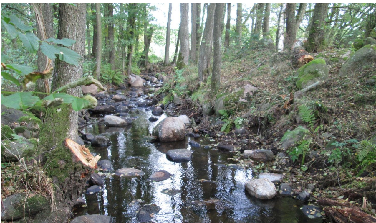
Bild: Exempel på blockrestaurerad strömsträcka vid Åvarp i Vege å. Block och sten har tagits från rensvallar längsmed strandkanten och lagts tillbaka i fåran.