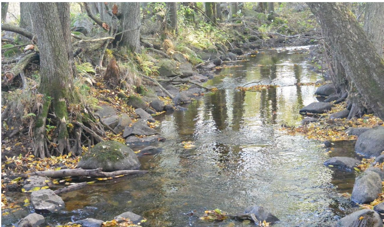
Bild: Exempel på blockrensad strömsträcka vid Åvarp i Vege å. Block och sten har tagits från fåran och lagts i rensvallar längsmed strandkanten.