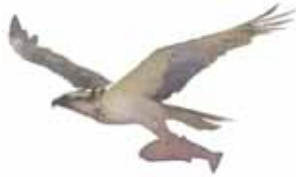
Illustration: Peter Nilsson

I nordväst ligger Hägghålet, rikt på grov död ved och klibbal, glasbjörk och sälgtill gagn för levermossor, svampar och insekter.