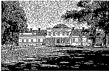
Gränsö slott som eldhärjades men byggdes upp på nytt 1994 är centrum för många evenemang.