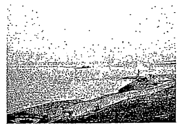
Badklippor vid Littön.