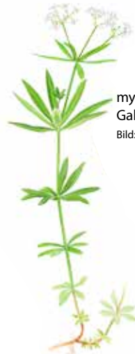
myskmadra Galium odoratum Bild: B. Mossberg