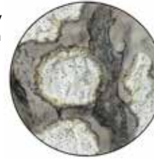
gammelekslav Lecanographa amylacea