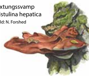
oxtungssvamp Fistulina hepatica