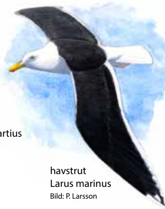
havstrut Larus marinus