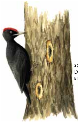
spillkråka Dryocopus martius