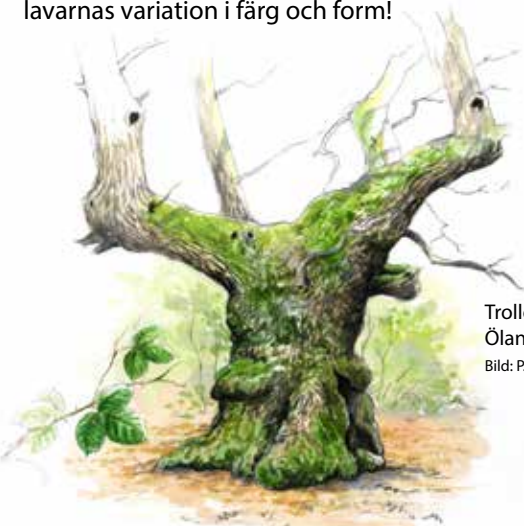
Trolleken – en av Ölands äldsta ekar.

Insprängda i tallskogen växer ett 30-tal gamla, grova ekar. Den grövsta är Trolleken, en av Ölands allra äldsta ekar. På ekarna har inte mindre än 155 olika lavar hittats. Många av dessa är sällsynta, både på Öland och i övriga landet. Ta dig en närmare titt på ekarnas skrovliga bark och upptäck lavarnas variation i färg och form!