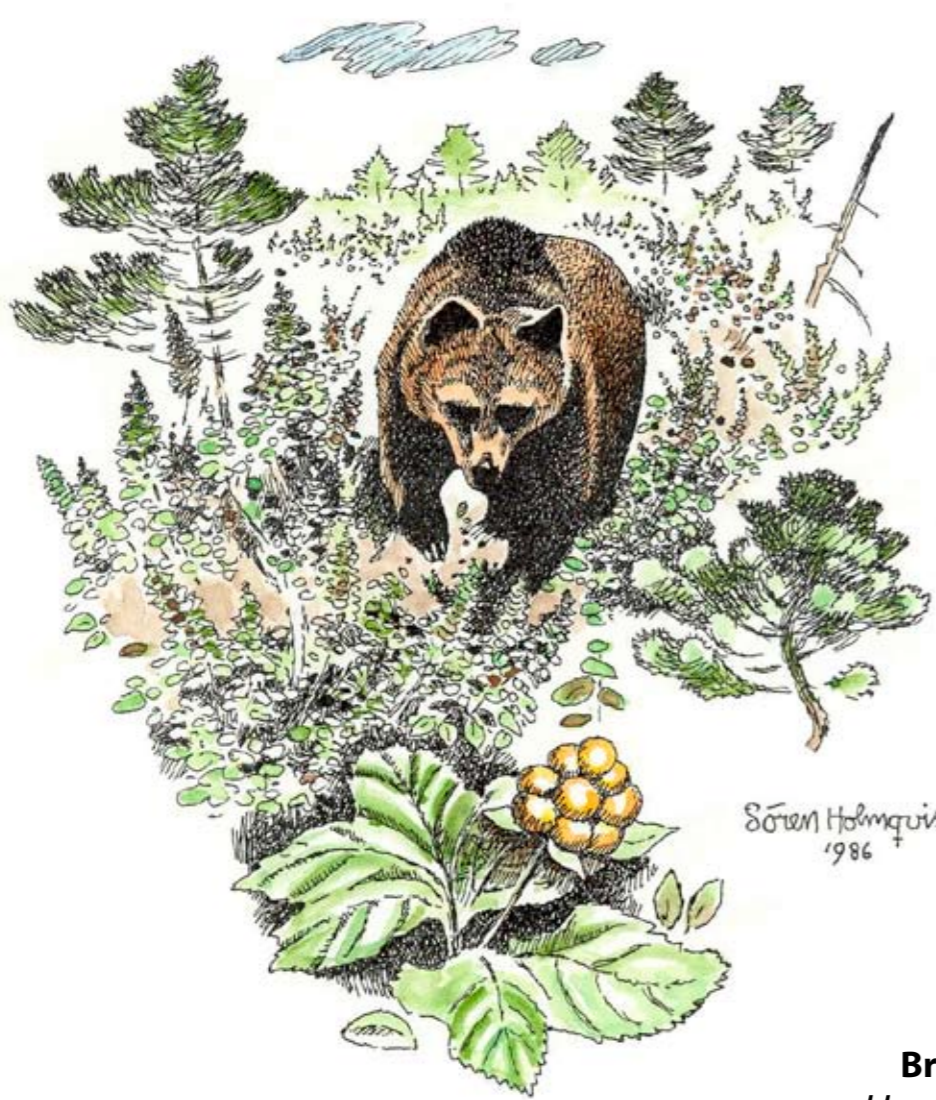
Brunbjörn Ursus arctos

I reservatet får du inte: § skada växande eller döda träd, vindfällan, stubbar eller lågor § framföra motordrivna fordon i terrängen, gäller både barmark och snötäckt mark