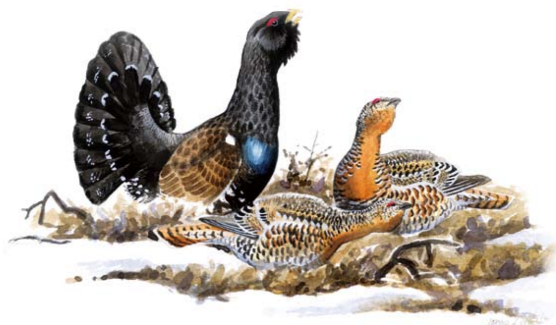
Tjäder Tetrao urogallus