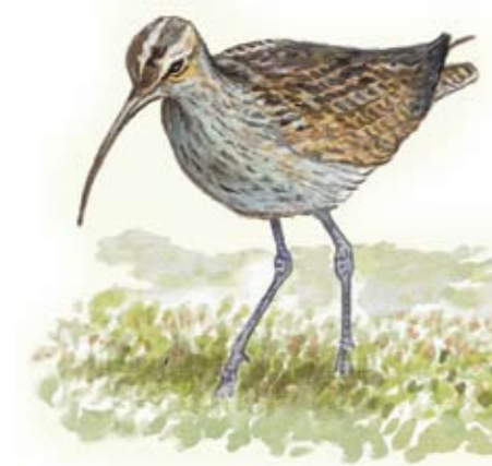
Småspov Numenius phaeopus

Koppången tillhör ett av Sveriges mest värdefulla myrlandskap. Höjden varierar mellan 450 och 650 meter. Högst är Stora Tunturibergets topp. I Koppången finns imponerande vidder med kärr och myrar som klättrar högt upp på bergssluttningarna.