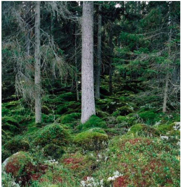
Blockig oktobergranskog.

En stig går från parkeringsplatsen in till reservatet (se karta).