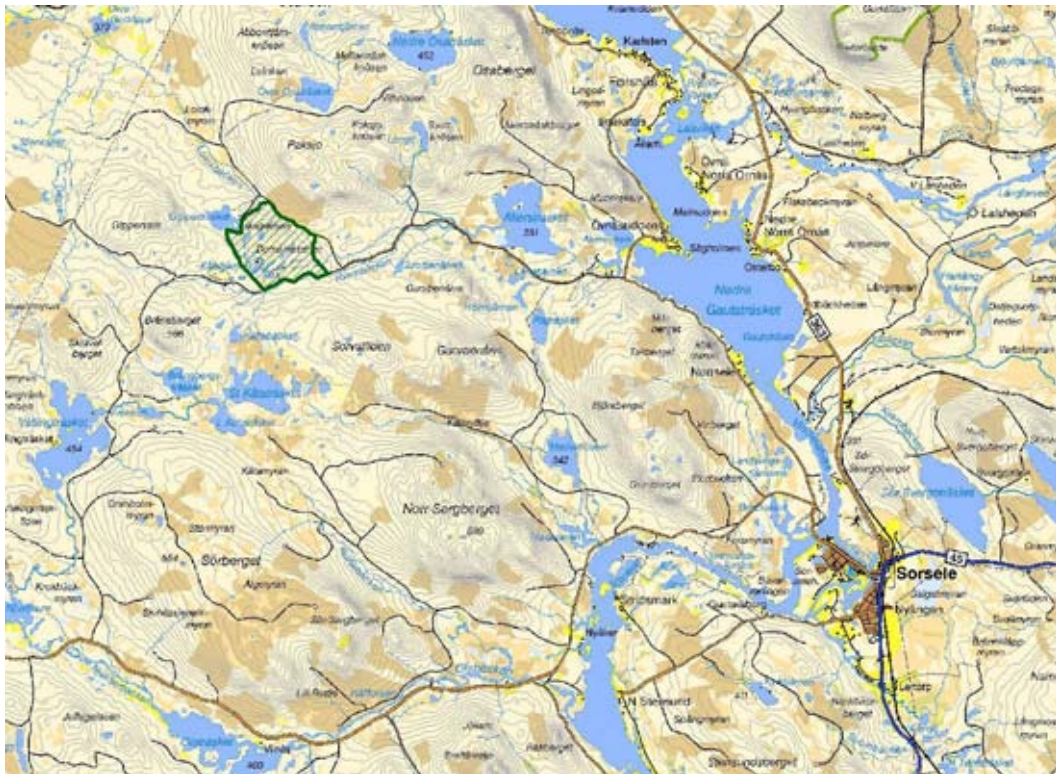
Figur 1. Översiktskarta för naturreservatet Liksgelisen.