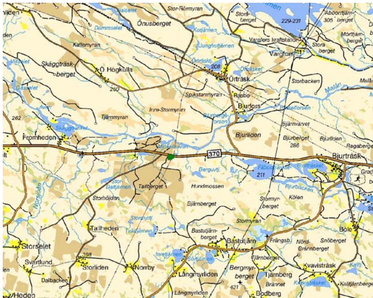
Figur 1. Översiktskarta för naturreservatet Kryddgrovan (markering i kartans mitt).

Reservatsföreskrifterna för Kryddgrovan har inte reviderats sedan området avsattes 1958. De är otidsenliga och ska därför ombearbetas inom gällande skötselplanperiod.