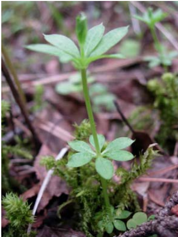
Bild 1. Myskmåra ( Galium triflorum ) är en av de mer sällsynta kärlväxterna i Kryddgrovans naturreservat.

Skogen ska få utvecklas fritt och utan hydrologisk påverkan. Norna följs upp inom ramen för Natura 2000.