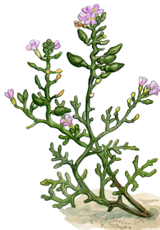
Marviol Cakile maritima

Stora Hults strand - en rest av ett uråldrigt beteslandskap som under tidigare epoker präglat Skånes kustområden.