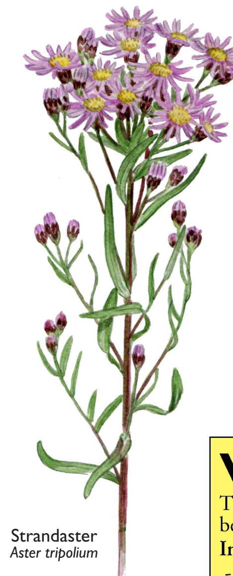
Strandaster Aster tripolium