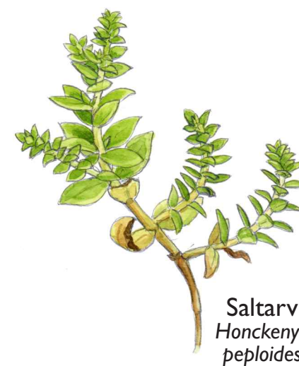
Saltarv Honckenya peploides