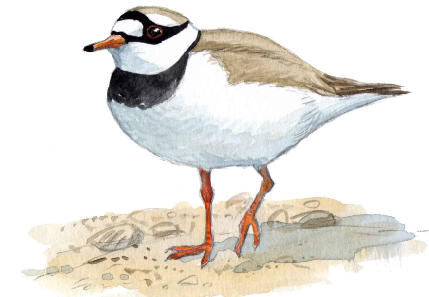
Större strandpipare Charadrius hiaticula

Längs kusten finns ett rikt fågelliv. Vid Stora Hults strand häckar flera olika sjöfåglar, bl. a. gravand, gräsand, ejder, småskrake, strandkata, större strandpipare, rödbena och gråtrut.