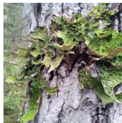
Lunglav trivs på gamla lövträd.