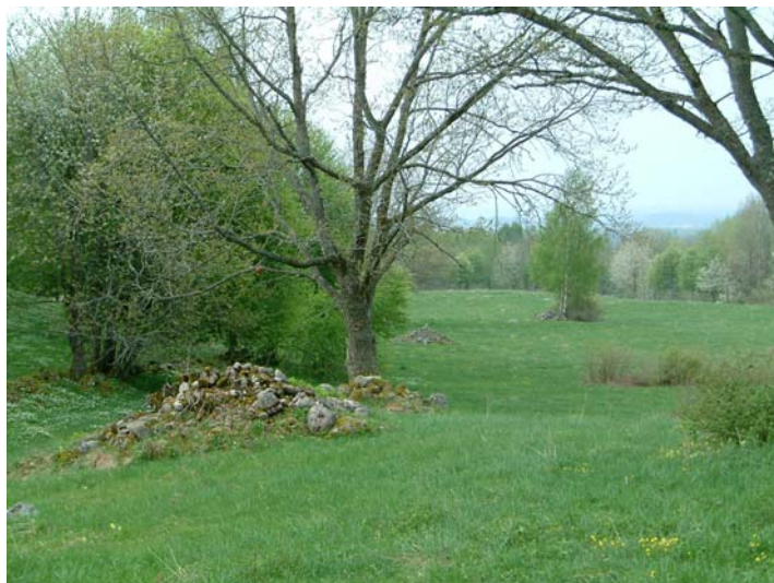
Vackra vyer över Valle.

Många av lövträden i området är gamla. Det finns också mycket död ved vilket bidrar till att göra naturreservatet till en intressant insektsmiljö med bl.a. ovanliga vedskalbaggar. Där hasseln bildar buskskikt finns typiska lundarter som trolldruva, blåsippa, skogsvicker, stinksyska, skogsbingel och ormbär. Reservatets skogar och gräsmarker hyser en rik svampflora, både vad gäller marksvamp och vedsvamp. Över 150 arter har noterats och av dessa är flera rödlistade eller på annat sätt ovanliga. I låglänta delar finns stora arealer med källpåverkade löv- och blandskogar. Här är det klibbal som är det dominerande trädslaget. I dessa delar är mossfloran välutvecklad och här växer även bl.a. kärrfibbla och skärmstarr.