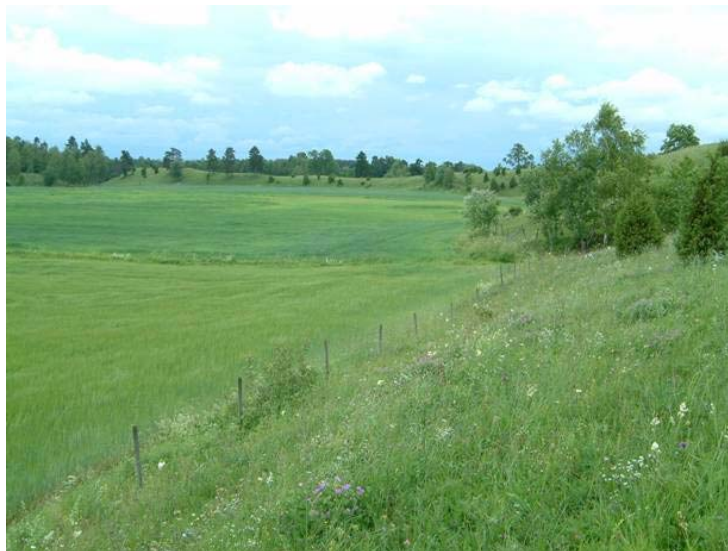
Vy mot söder vid Smula ås, foto Länsstyrelsen

Den norra åssträckningen har tidigare haft ett tätare trädskikt, men detta område har gallrats. De norra och mellersta delarna av reservatet har ett sent betespåsläpp, medan de södra delarna har en längre betessång och ett hårdare bete.