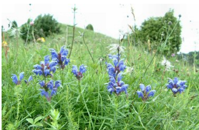
Drakblomma, orientens pärla, växer vid Smula ås.