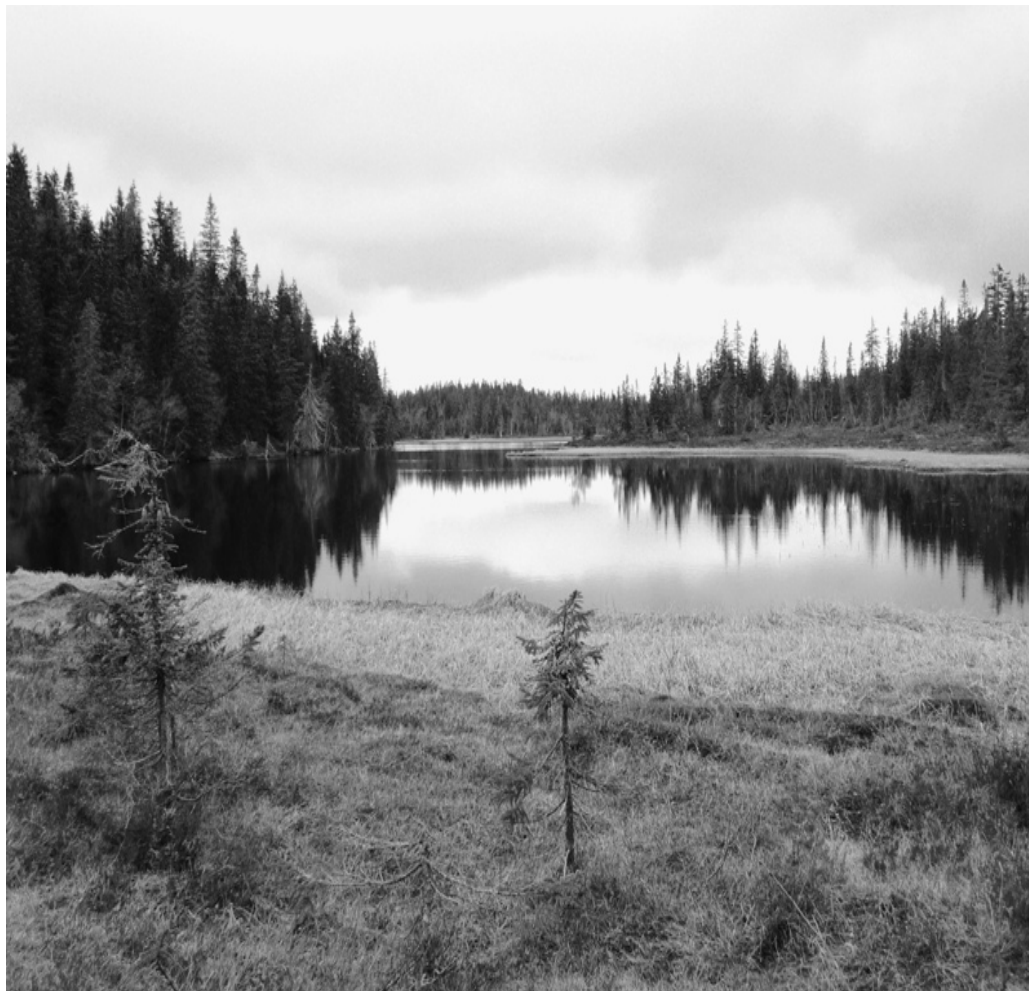
Bild från Långtjärnen