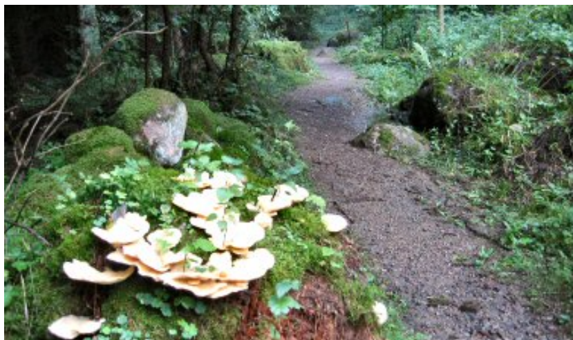
Faledreven och Brunnhemsleden passerar Ruskela källa.

Vandra på Faledreven, Skaraborgs bäst bevarade fädrev, och nå Ruskela källa.