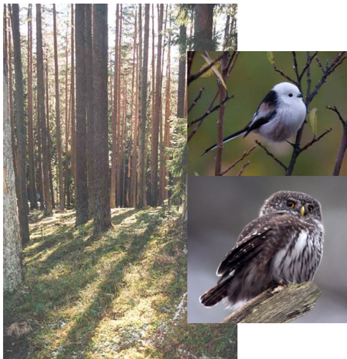
Stjärtmes* och sparvuggla, några av Grimmestorps invånare.