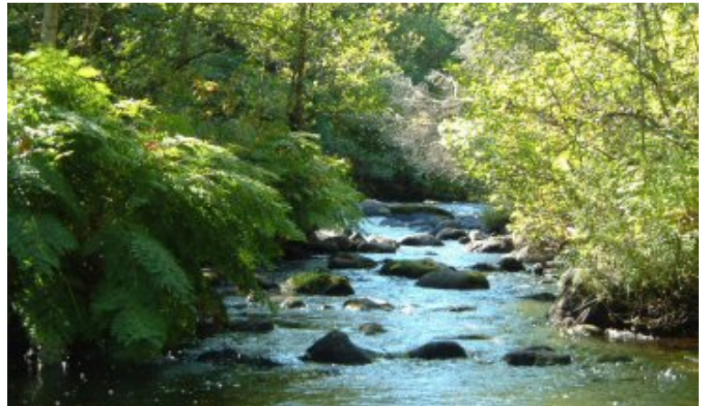
Ettaks strömmar.

Klockgentiana ( Gentianella pneumonanthe ) finns i en betad fuktäng i nordöstra delen av reservatet. Området stängslades in 2004 och bete påbörjades efter att legat nere en tid. Klockgentianan är sällsynt och har en västlig utbredning. Bete eller slåtter krävs för att den ska trivas.