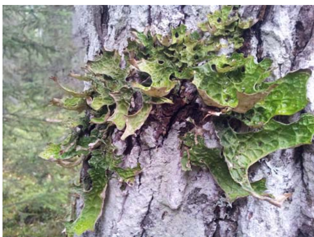
Lunglav trivs på äldre lövträd i platåbergsbranten.

Reservatet består även av en skogklädd brant nedanför Billingens platå. I branten växer äldre blandskog med stort inslag av ädellövträd. Kryptogamfloran är rik och bjuder på en rad rödlistade arter.