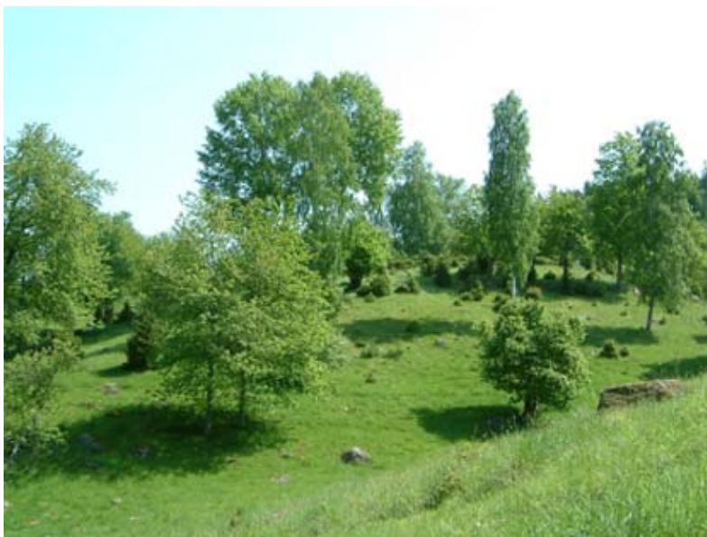
Kulturlandskap kring Bockaskedeåsen.

Här och var tränger det fram källflöden som blir till små bäckar. Berggrunden gör att källvattnet blir mineralrikt. Källsprängen utgör därför ofta mycket intressanta mosslokaler.