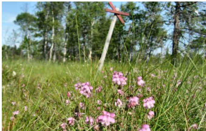
Klockklung på Blängsmossen

Det som gör Blängsmossen unikt i sitt slag är de så kallade sprickkärrsfönstren. Dessa har troligen bildats genom att näringsrikt vatten trängt upp från fastmarken under mossen i samband med att mossen glidit isär. Detta är ett ovanligt fenomen och man känner inte till det från någon annan svensk mosse. När vattnet sedan avvattnas från mossen till omgivande mark, bildas olika typer av kärr.