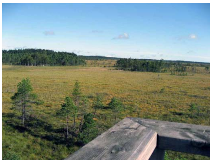
Det finns ett fågeltorn i området där man har utsikt över mossen.