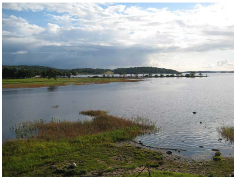
Restaurerade strandängar.

De tidigare igenvuxna strandängarna har restaurerats och betas numera av kor. Här häckar arter som tofsvipa, gulärta och enkelbeckasin. I alskogen och videsnåren uppehåller sig hackspettar och många olika småfågelarter. Området är nog ändå mest känt som rastlokal för flyttfåglar. Änder, svanar och kanadagäss kan ofta ses i stora flockar på våren och hösten.