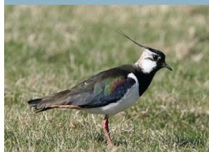
Sångsvanar samt tofsvipa.