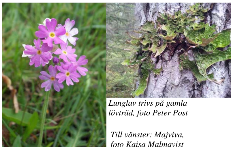
Lunglav trivs på gamla lövträd