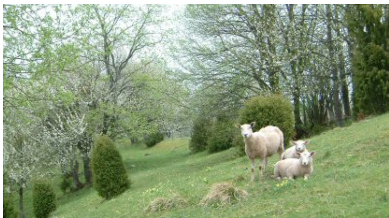
Betesmarker med hävdgynnad flora finns.

Höjentorps gård har anor från år 1284 då den tillhörde biskopsämbetet. Så småningom kom gården att bli en kungsgård som tillhörde kronan. Magnus Gabriel de la Gardie lät bygga ett slott här, som dessvärre brann ned 1722. Det finns idag bara en källare kvar efter slottet. I den gamla slottsparken finns stora lövträd och förvildade parkväxter som akleja och krollilja. Fastigheten är statligt byggnadsminne.