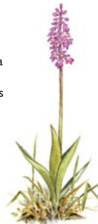
Sankte Pers nycklar.

Därför är det ingen överraskning att floran är fin i Högsböla. Här trivs gullviva, brudbröd, ormrot, ramslök, vildlin, svinrot - och den vackra orkidén Sankt Pers nycklar.