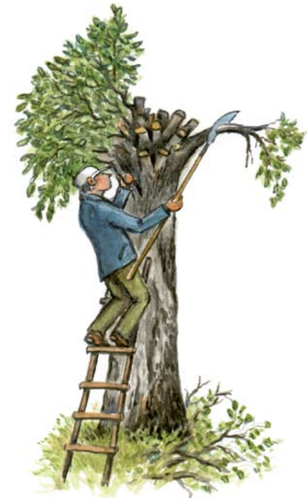
Hamling vid Högsböla.

PRODUKTION Länsstyrelsen i Västra Götalands län, 2009 | TEXT Jan Mogel ILLUSTRATIONER Niklas Johansson och Göran Boström | LAYOUT Tove Lund