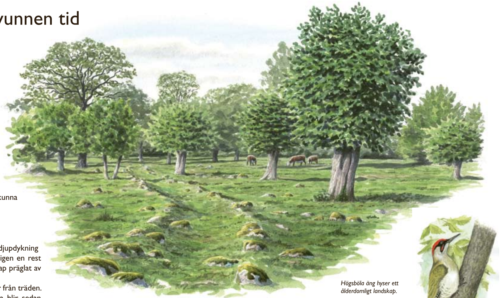
Högsböla äng hyser ett ålderdomligt landskap.

I naturreservatet vid Högsböla äng finns faktiskt fortfarande en rad hamlade träd. Det ser kanske lite lustigt ut i nutidsmänniskans ögon. Tjocka trädstammar som abrupt övergår i tunna kvistar. Kvistar som påminner om fingrar som strävar mot skyn.