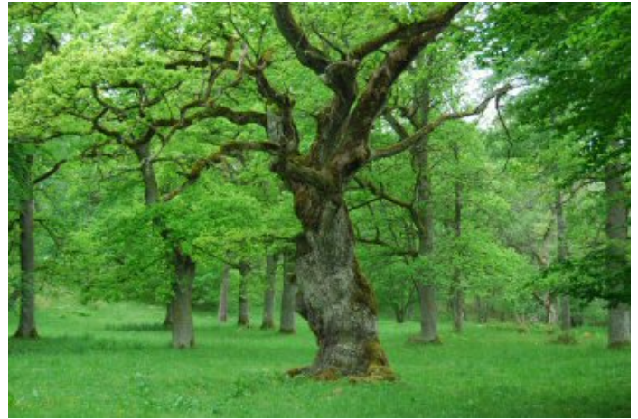
Forentorpa ängar.

Dagens Forentorpa ängar består till största delen av välbetade lövhagar många grova ekar och askar. Vissa ekar är säkerligen 400 år gamla och härstammar från de gamla lövängarna. Ekarna är viktiga för ett stort antal arter av svampar, lavar och djur. Bland annat växer den frodigt gröna lunglaven i området.