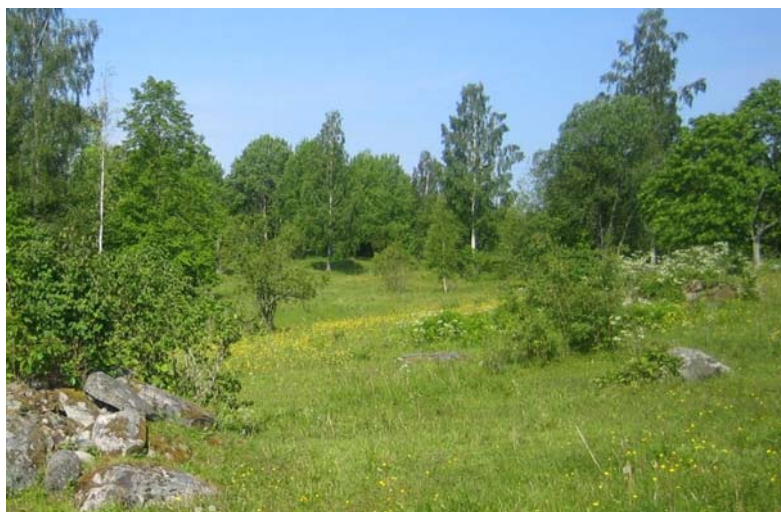
Hävdade marker i Bölets ängar.

Berggrunden i Böletområdet utgörs av lättvittrade grönstenar. Det höga kalkinnehållet i marken ger förutsättningar för en hög artrikedom. I ängs- och hagmarkerna förekommer hävdgynnade arter som slätterblomma, ormtunga och senblommande fältgentiana. I reservatet finns flera arter av orkideer. Bland lundväxterna återfinns arter som storrams, lundelm, vårärt, vätteros och strävlost. I naturreservatets kalkbarrskogar har flera ovanliga arter av taggsvampar hittats.