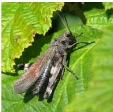
Trumgräshoppa Till höger fältgentiana