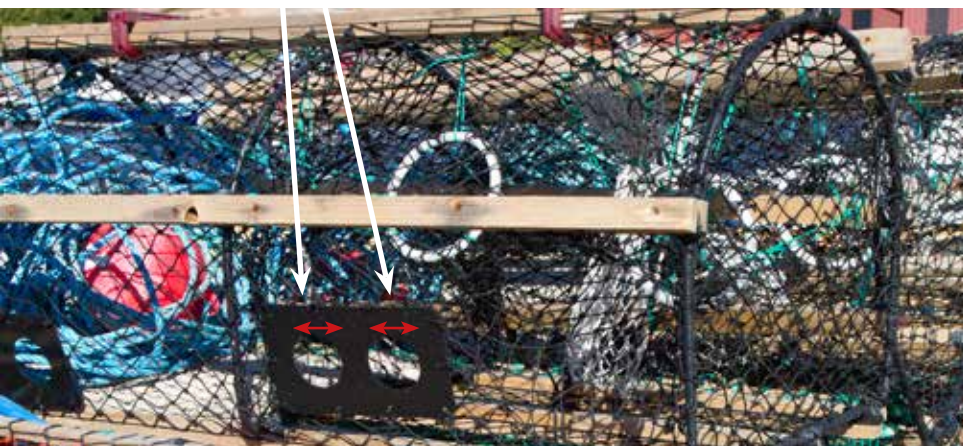
Figur 6. Hummertina med flyktöppningar.

Kulan/cylindern ska vara märkt med identitet. Märkningen ska bestå av fullständigt för- och efternamn och adress eller telefonnummer eller särskilt registreringsnummer som Länsstyrelsen tidigare tillhandahållit. Den som bedriver fritidsfiske ska även märka sin utmärkning med stora bokstaven F. Märkningen ska finnas på fiskekulan, vakaren eller cylindern. För yrkesfiske finns också andra märkningsformer.