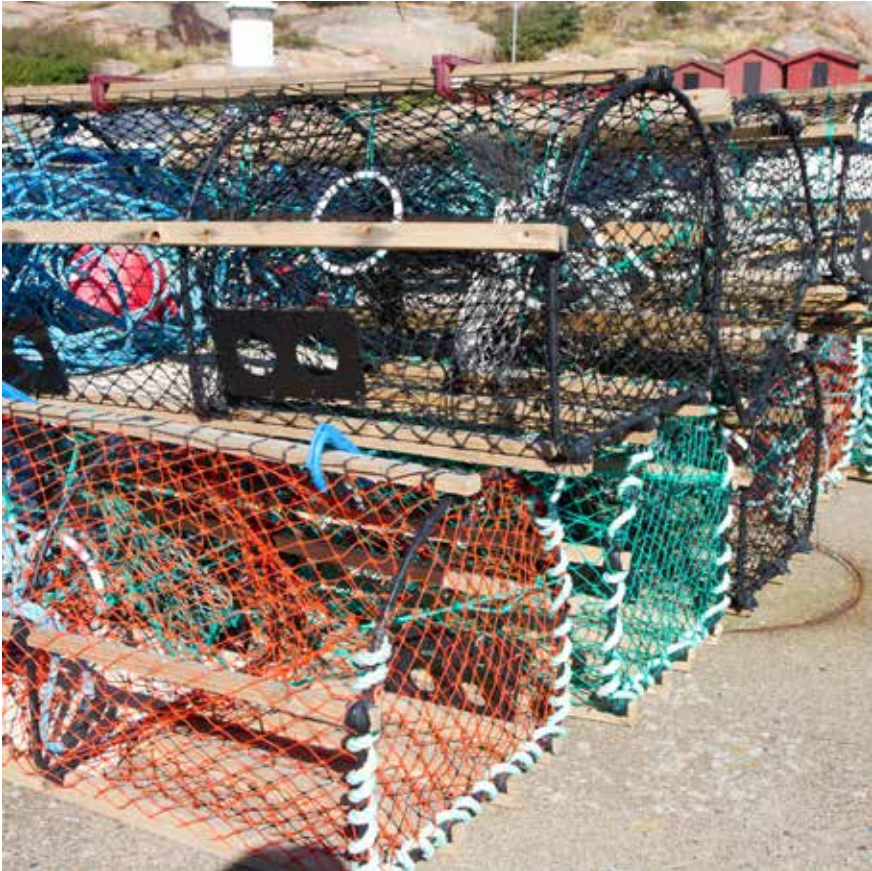
Figur 1. En hummertina ska ha minst två cirkulära flyktöppningar med en minsta diameter om 60 mm placerade i den nedre kanten av varje rums yttervägg.

en hona är 8–9 mm. Äldre humrar tillväxer allt mindre för varje skalömsning. Riktigt stora humrar ökar bara någon millimeter vid ömsningen.