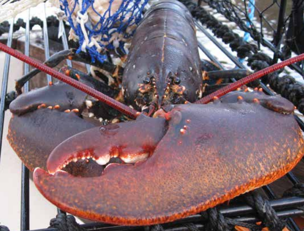
Figur 7. Hummertina med fångst.

Linan mellan redskapen och utmärkningen ska vara av ett material som är sjunkande alternativt vara nedtyngd. En lina som flyter på vattenytan medför en direkt fara för sjötrafiken.