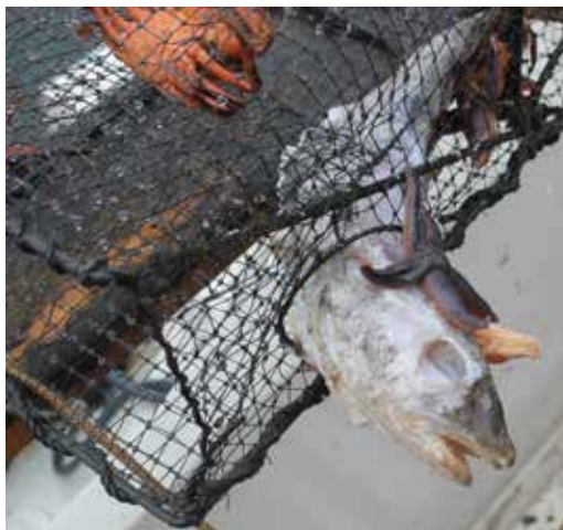
Figur 9. Torsk som fastnat i ett spökreder och dött.

Brott mot fiskebestämmelser faller under allmänt åtal och kan ge böter eller fängelse. Fiskeredskap kan be-