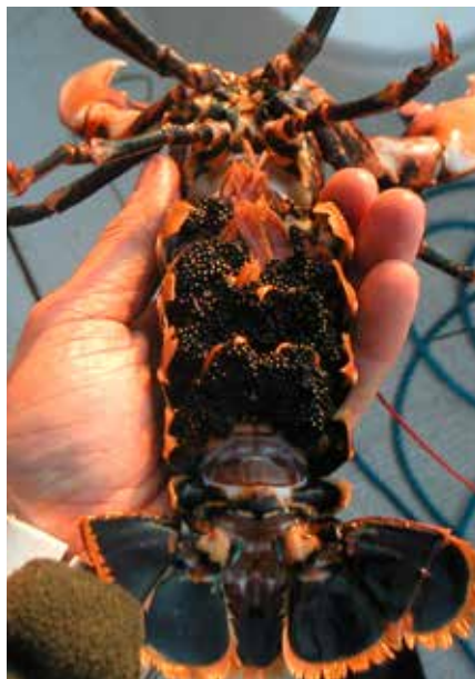
Figur 5. Hummer med yttre rom ska omedelbart återutsättas.

blir hög sprider sig olika arter utanför området. Ett olovligt fiske inom dessa områden skulle alltså missgynna möjlighet till fångst i närliggande områden och dessutom skada de fredade bestånden inom områdena. Fredningsområdena är även viktiga för forskningen då de bland annat ger ökad kunskap om ofiskade beståndsdynamik. Inom Kävra fredningsområde är allt fiske, förutom fiske med handredskap, förbjudet hela året. Inom Buskärs och Tanneskärs är allt fiske förbjudet under hela året.