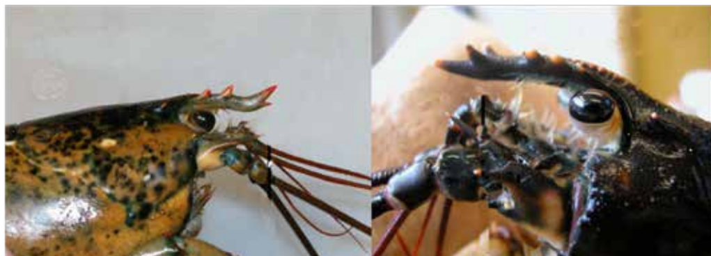
Figur 10. Skillnaden mellan amerikansk och europisk hummer.