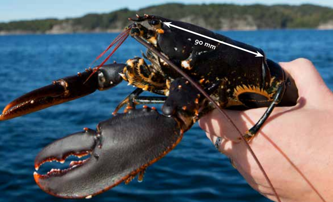
Figur 4. Hummer där minimimåttet – 90 mm – är illustrerat.

blir hög sprider sig olika arter utanför området. Ett olovligt fiske inom dessa områden skulle alltså missgynna möjlighet till fångst i närliggande områden och dessutom skada de fredade bestånden inom områdena. Fredningsområdena är även viktiga för forskningen då de bland annat ger ökad kunskap om ofiskade beståndsdynamik. Inom Kävra fredningsområde är allt fiske, förutom fiske med handredskap, förbjudet hela året. Inom Buskärs och Tanneskärs är allt fiske förbjudet under hela året.