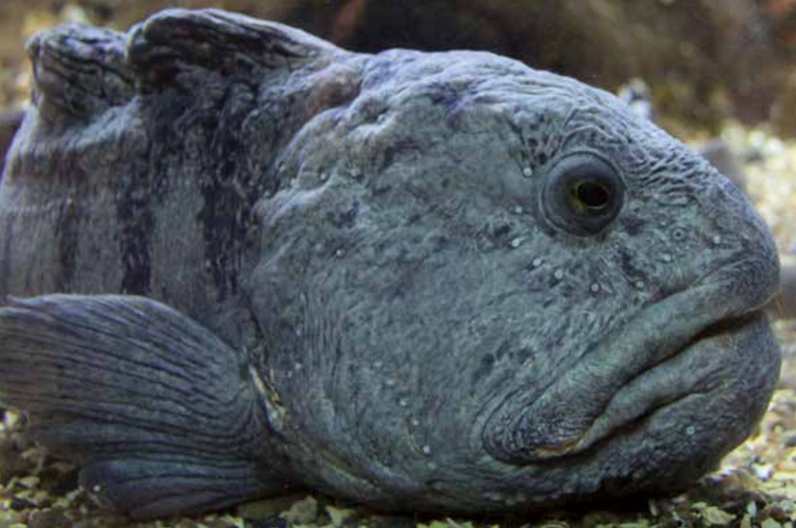
Havskatt är numera en ovanlig fisk i Skagerrak.

Förbudet gäller både handredskap och rörliga redskap. Det är förbjudet att fiska hälleflundra från den 20 december till och med 31 mars.