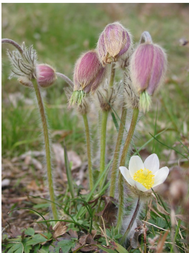
I Valsjöheden växer den sällsynta mosippan.

Valsjöheden är sedan mitten av 1950-talet en skyddad växtplats för den sällsynta mosippan, som bara finns på ett tjugotal platser i länet. Reservatet är en del av en flack grusås, som mest består av sand. På åsen växer en nittioårig tallskog.